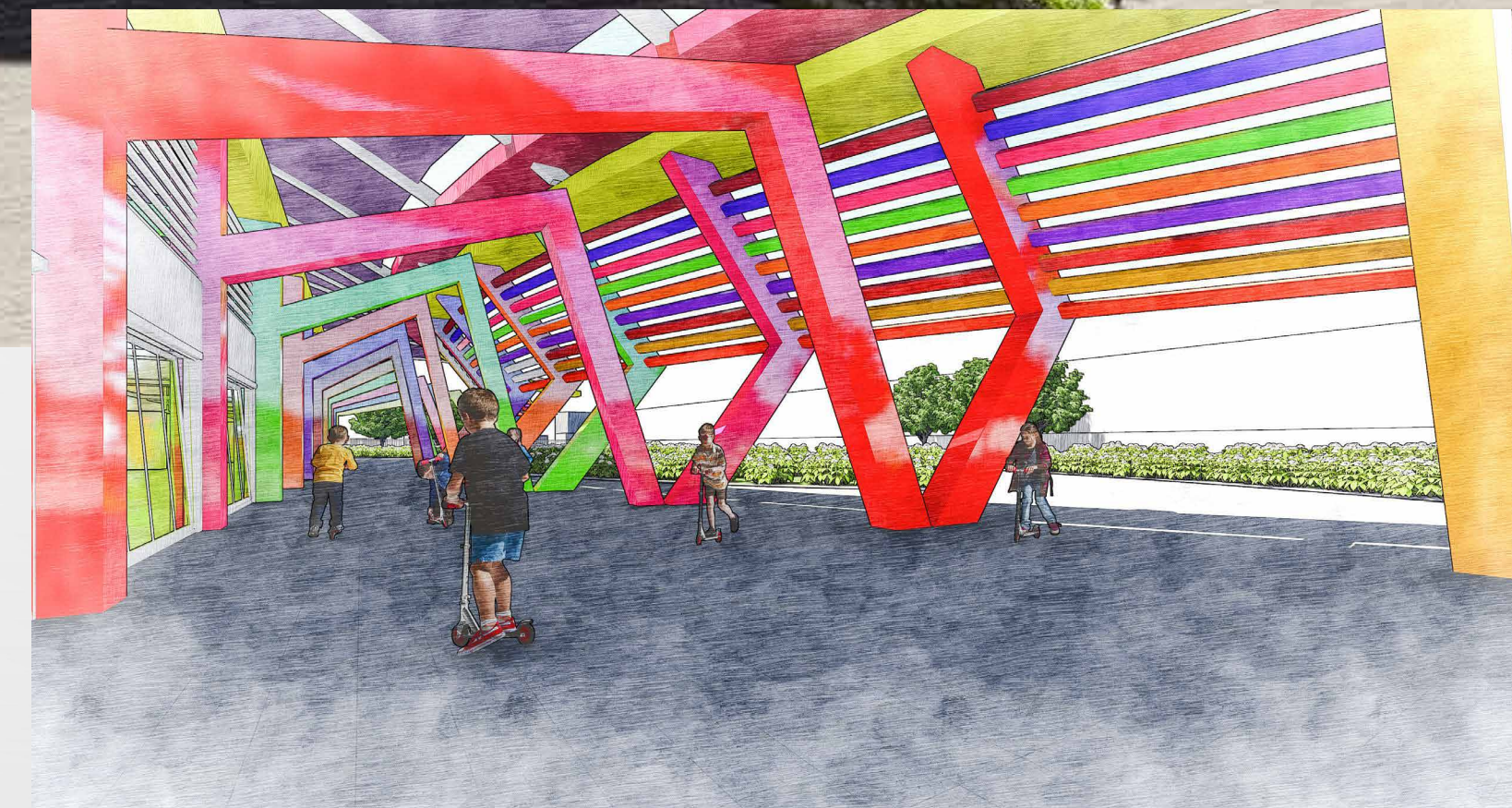
PERSPECTIVA-patio lateral com vista dos pilares com efeito ludico.