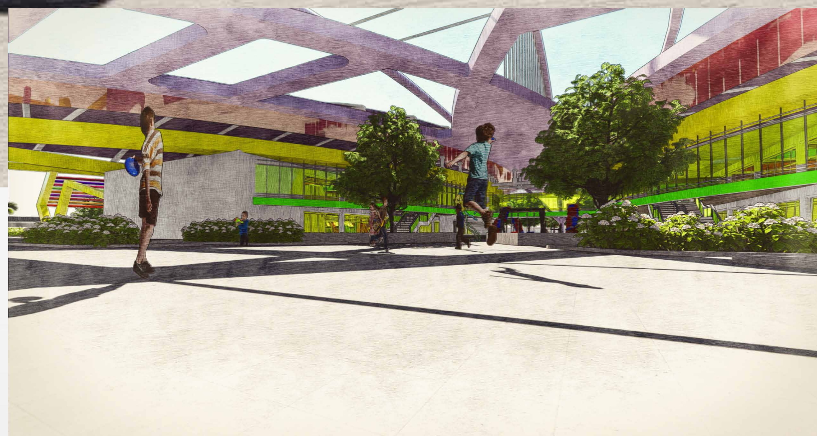
PERSPECTIVA-Vista para o patio central e estrutura da cobertura.