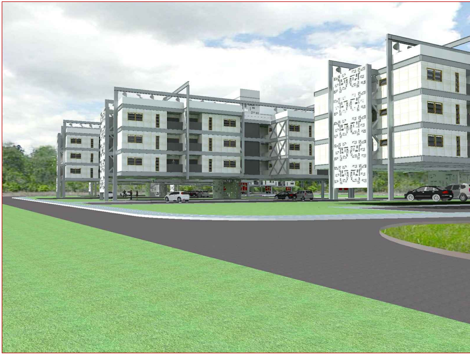
VISTA DAS EMPENAS COM OS PAINÉIS METÁLICOS