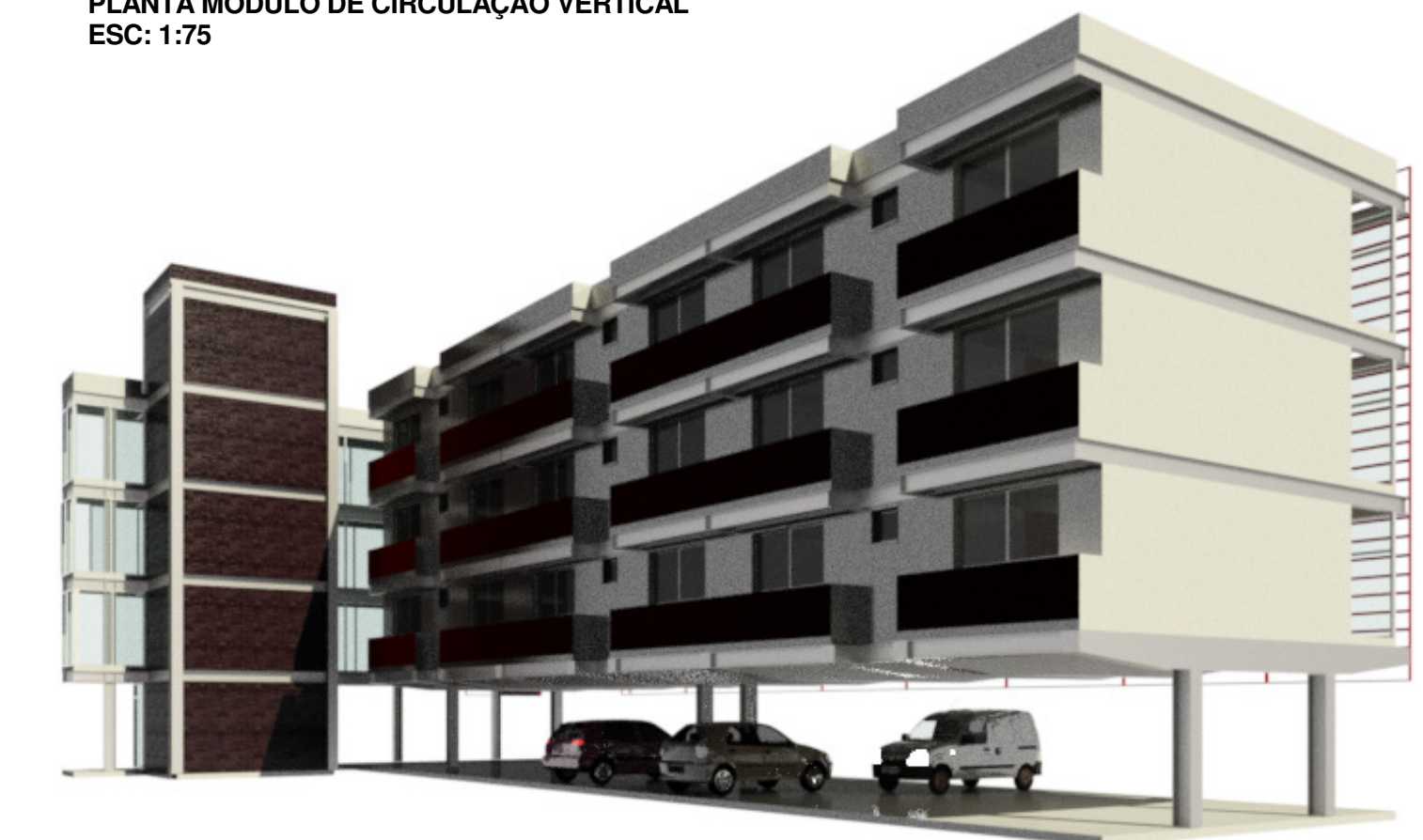
MODULO 1 + MODULO 2 (CIRCULAÇÃO VERTICAL + APARTAMENTOS)