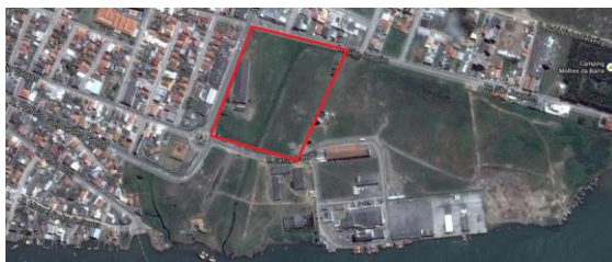
Área de implantação

Para a implantação foi escolhido um terreno localizado no bairro Mar Grosso cortado por um pequeno córrego de água, gerando uma APP com total de 60 metros permitindo que a natureza integre o projeto. Delimitado pelas avenidas São Joaquim e João Pinho, de grande movimento no bairro. A área também é servida de basicamente todos os equipamentos necessários.